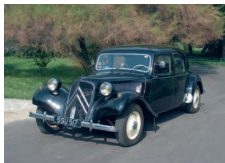
Citroën Traction Avant An fabricație: 1955, motor: 1911 cmc, putere: 46 CP, masă proprie: 1500 Kg.