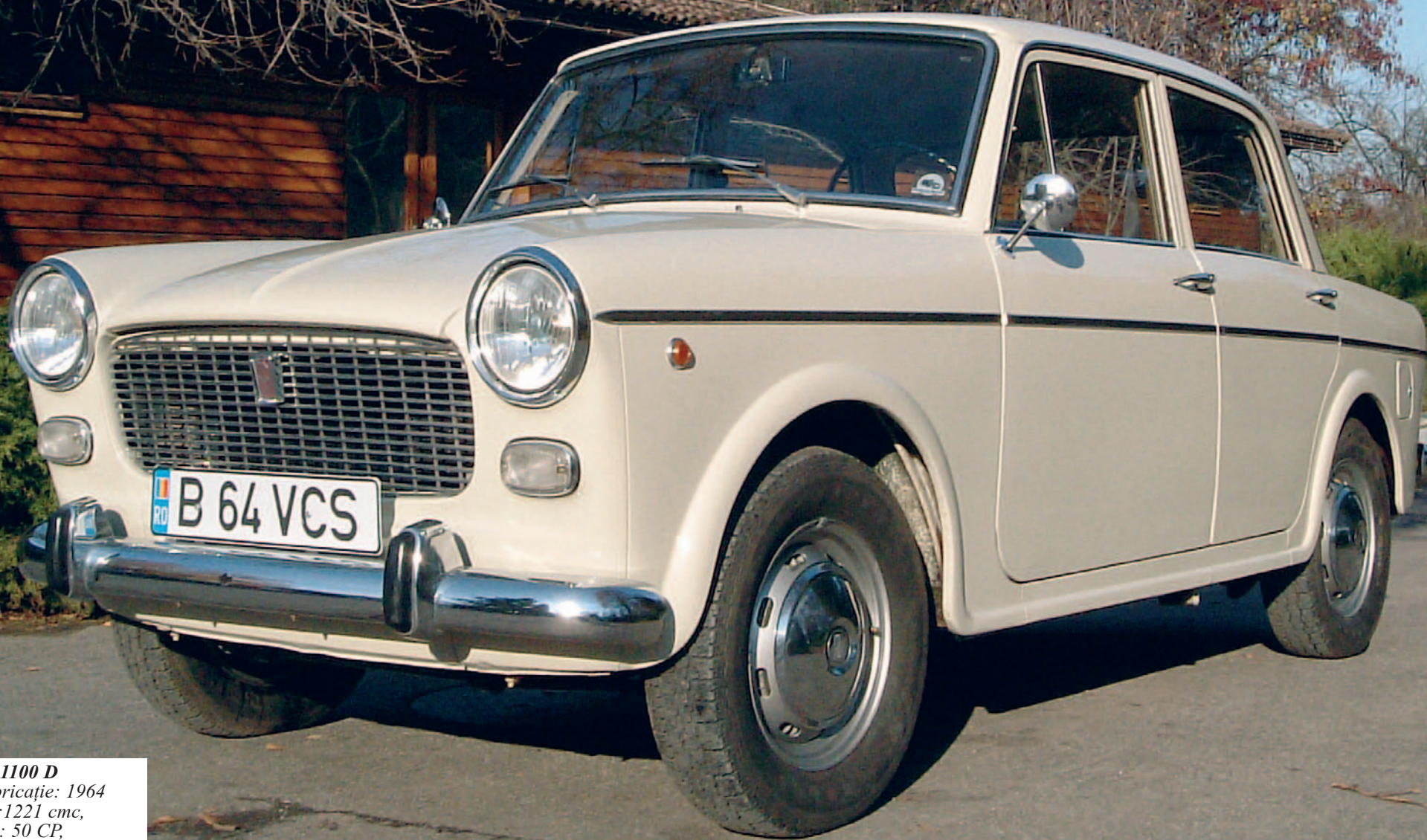
FIAT 1100 D An fabricație: 1964 motor: 1221 cmc, putere: 50 CP, masă proprie: 895 Kg. restaurat: oldtimer.ro