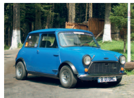
Austin Mini An fabricație: 1964, motor: 848 cmc, putere: 35 CP, masă proprie: 620 Kg, restaurat: automobilia.ro