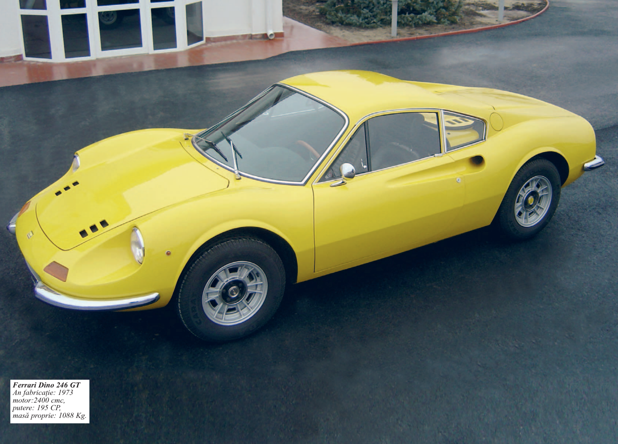
Ferrari Dino 246 GT An fabricație: 1973 motor: 2400 cmc, putere: 195 CP, masă proprie: 1088 Kg.