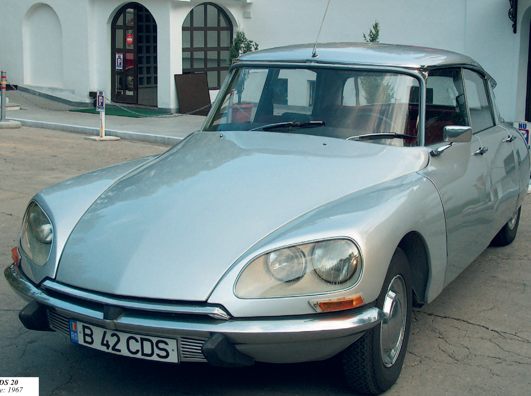
CITROËN DS 20 An fabricație: 1967 motor: 1984 cmc, putere: 92 CP, masă proprie: 1280 Kg.