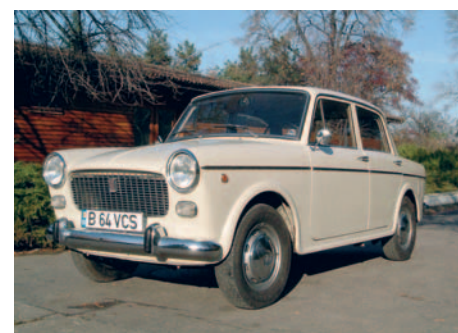
FIAT 1100 D An fabricație: 1964, motor: 1221 cmc, putere: 50 CP, masă proprie: 895 Kg, restaurat: oldtimer.ro