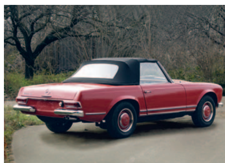
Mercedes Benz 230 SL An fabricație: 1963, motor: 2281 cmc, putere: 120 CP, masă proprie: 1200 Kg, restaurat: oldtimer.ro