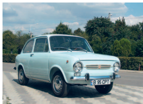
FIAT 850 An fabricație: 1967, motor: 843 cmc, putere: 34 CP, masă proprie: 670 Kg.