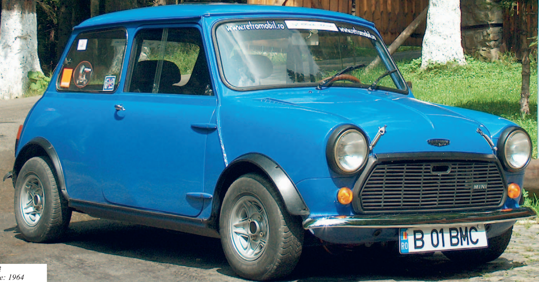
Austin Mini An fabricație: 1964 motor: 848 cmc, putere: 35 CP, masă proprie: 620 Kg restaurat: automobilia.ro