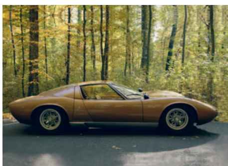
Lamborghini Miura An fabricație: 1968, motor: 4000 cmc, putere: 375 CP, masă proprie: 980 Kg.