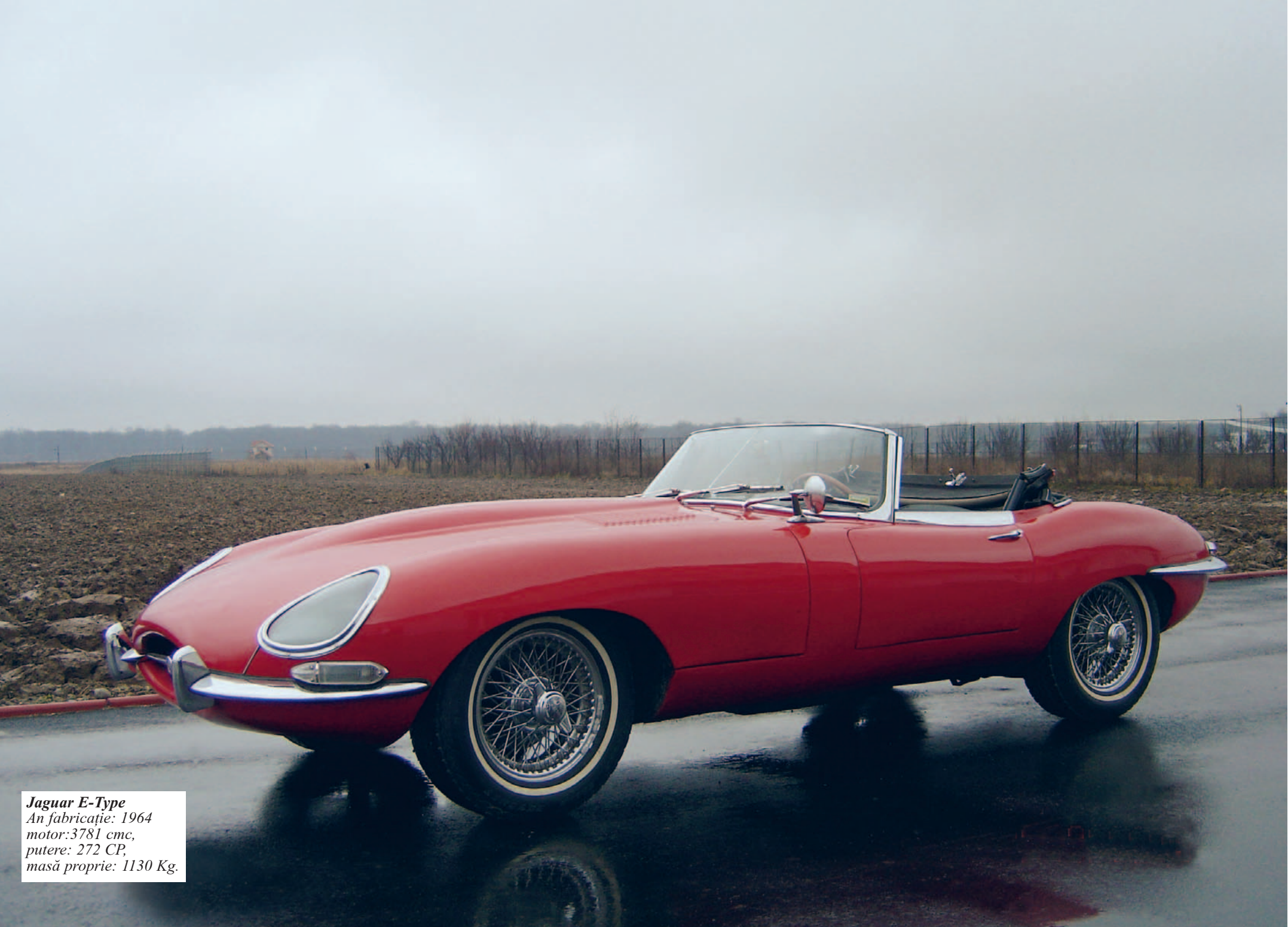
Jaguar E-Type An fabricație: 1964 motor: 3781 cmc, putere: 272 CP, masă proprie: 1130 Kg.