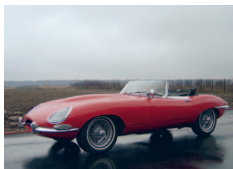
Jaguar E-Type An fabricație: 1964, motor: 3781 cmc, putere: 272 CP, masă proprie: 1130 Kg.