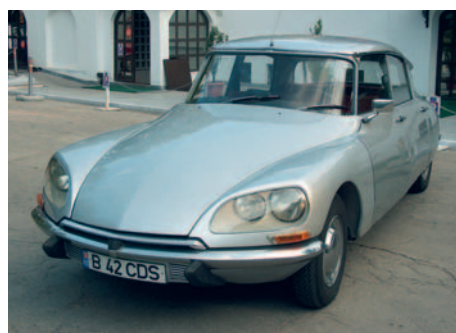
CITROËN DS 20 An fabricație: 1967, motor: 1984 cmc, putere: 92 CP, masă proprie: 1280 Kg.