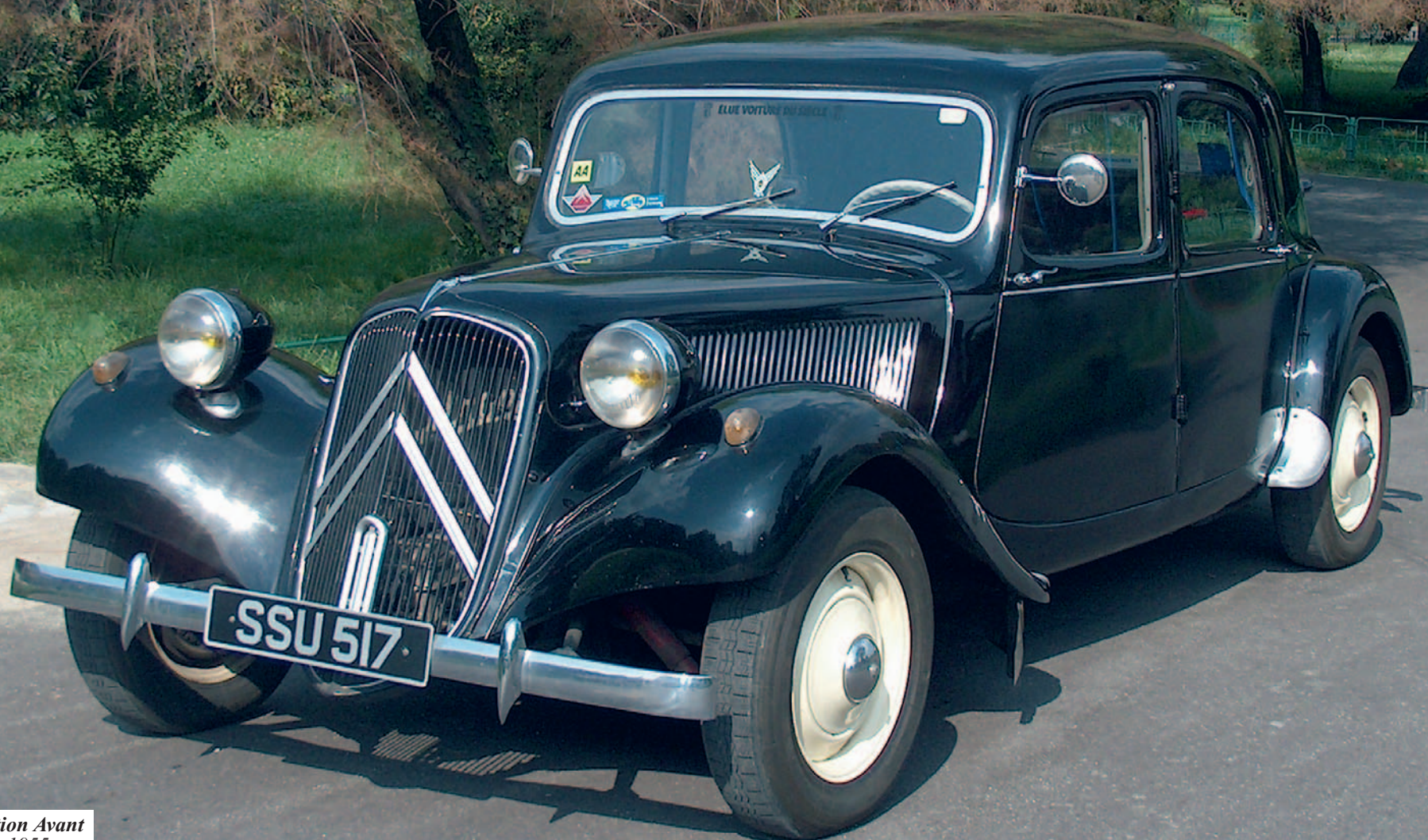
Citroën Traction Avant An fabricație: 1955 motor: 1911 cmc, putere: 46 CP, masă proprie: 1500 Kg.