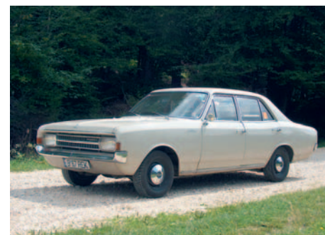
OPEL REKORD 1700 An fabricație: 1967, motor: 1675 cmc, putere: 75 CP, masă proprie: 1030 Kg.