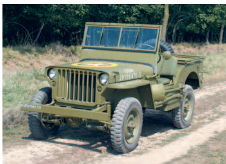
Ford GPW An fabricație: 1943, motor: 2180 cmc, putere: 57 CP, masă proprie: 1050 Kg, restaurat: oldtimer.ro