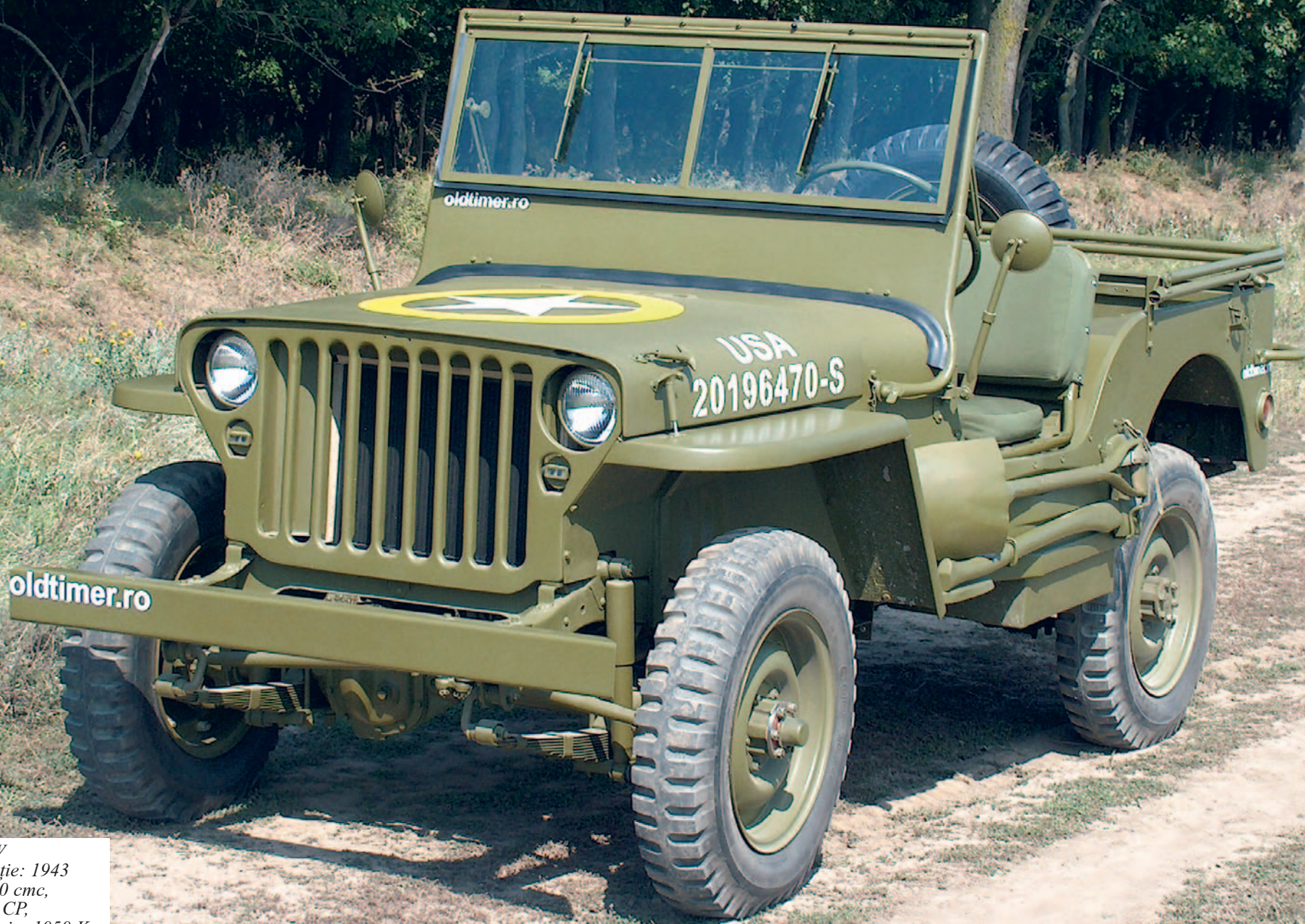
Ford GPW An fabricație: 1943 motor: 2180 cmc, putere: 57 CP, masă proprie: 1050 Kg. restaurat: oldtimer.ro