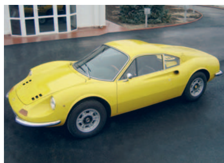
Ferrari Dino 246 GT An fabricație: 1973, motor: 2400 cmc, putere: 195 CP, masă proprie: 1088 Kg.