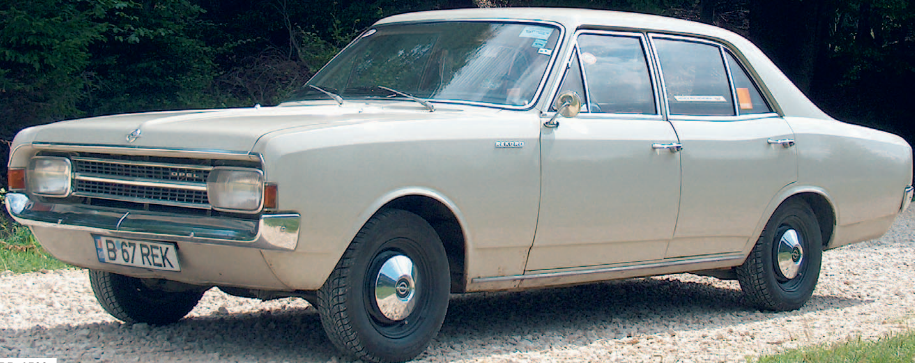
OPEL REKORD 1700 An fabricație: 1967 motor: 1675 cmc, putere: 75 CP, masă proprie: 1030 Kg.