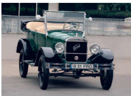
Ford T An fabricație: 1926, motor: 2896 cmc, putere: 19 CP, masă proprie: 545 Kg, restaurat: autoclassicforum.ro