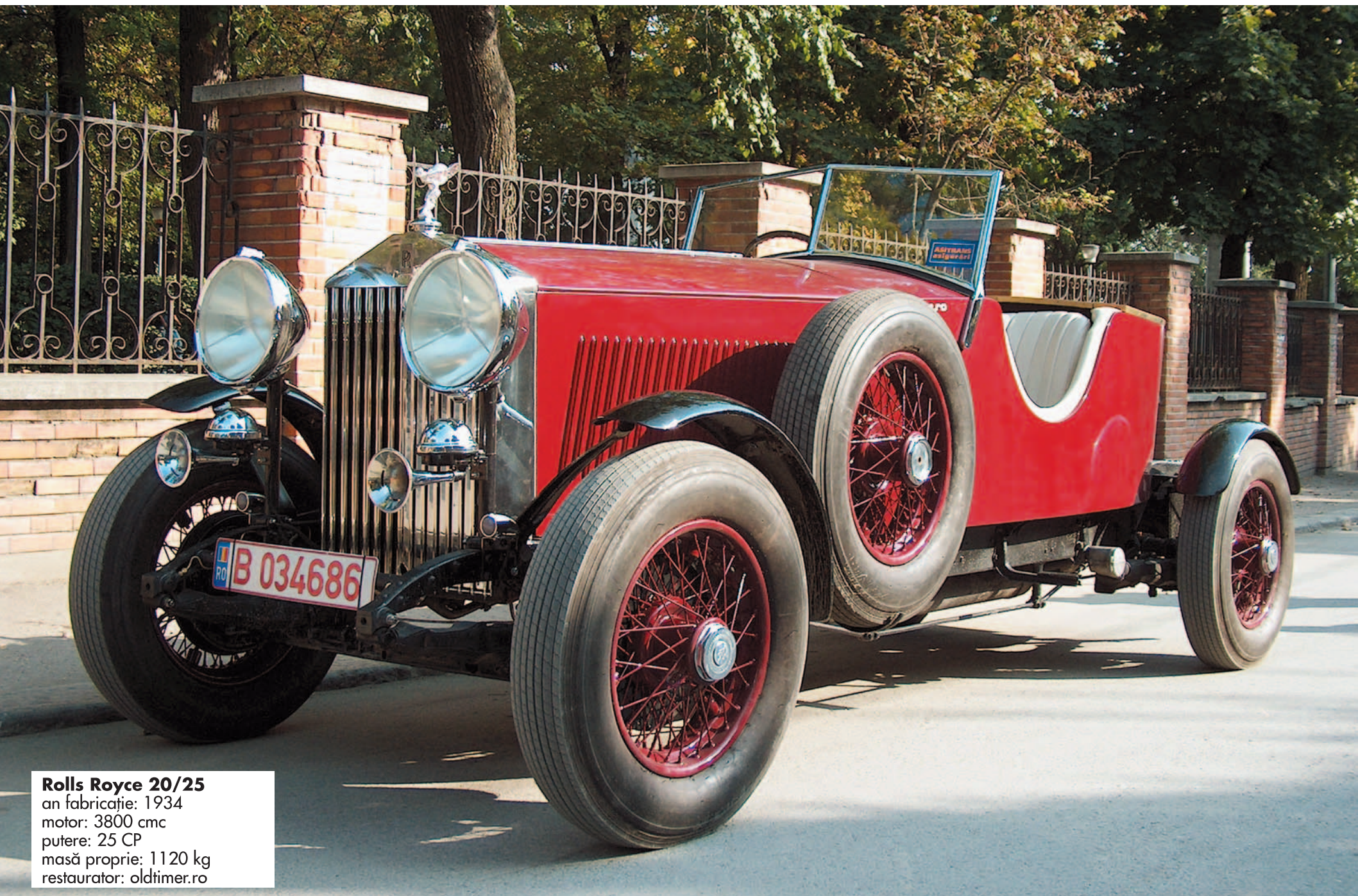
Rolls Royce 20/25 an fabricație: 1934 motor: 3800 cmc putere: 25 CP masă proprie: 1120 kg restaurator: oldtimer.ro