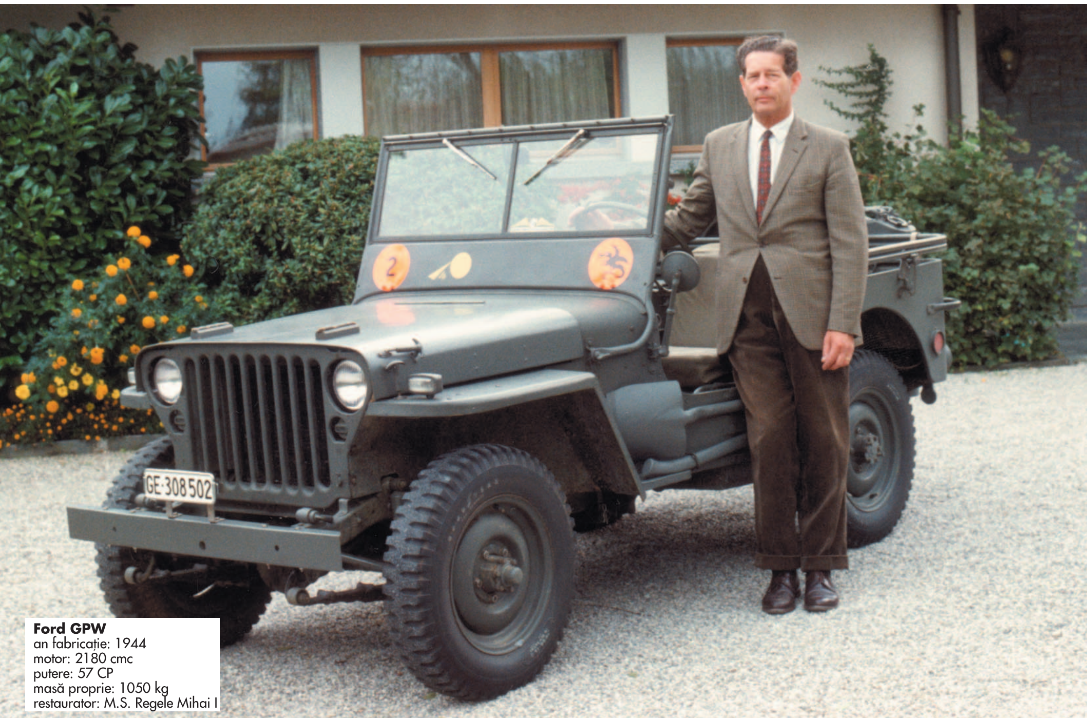
Ford GPW an fabricație: 1944 motor: 2180 cmc putere: 57 CP masă proprie: 1050 kg restaurator: M.S. Regele Mihai I