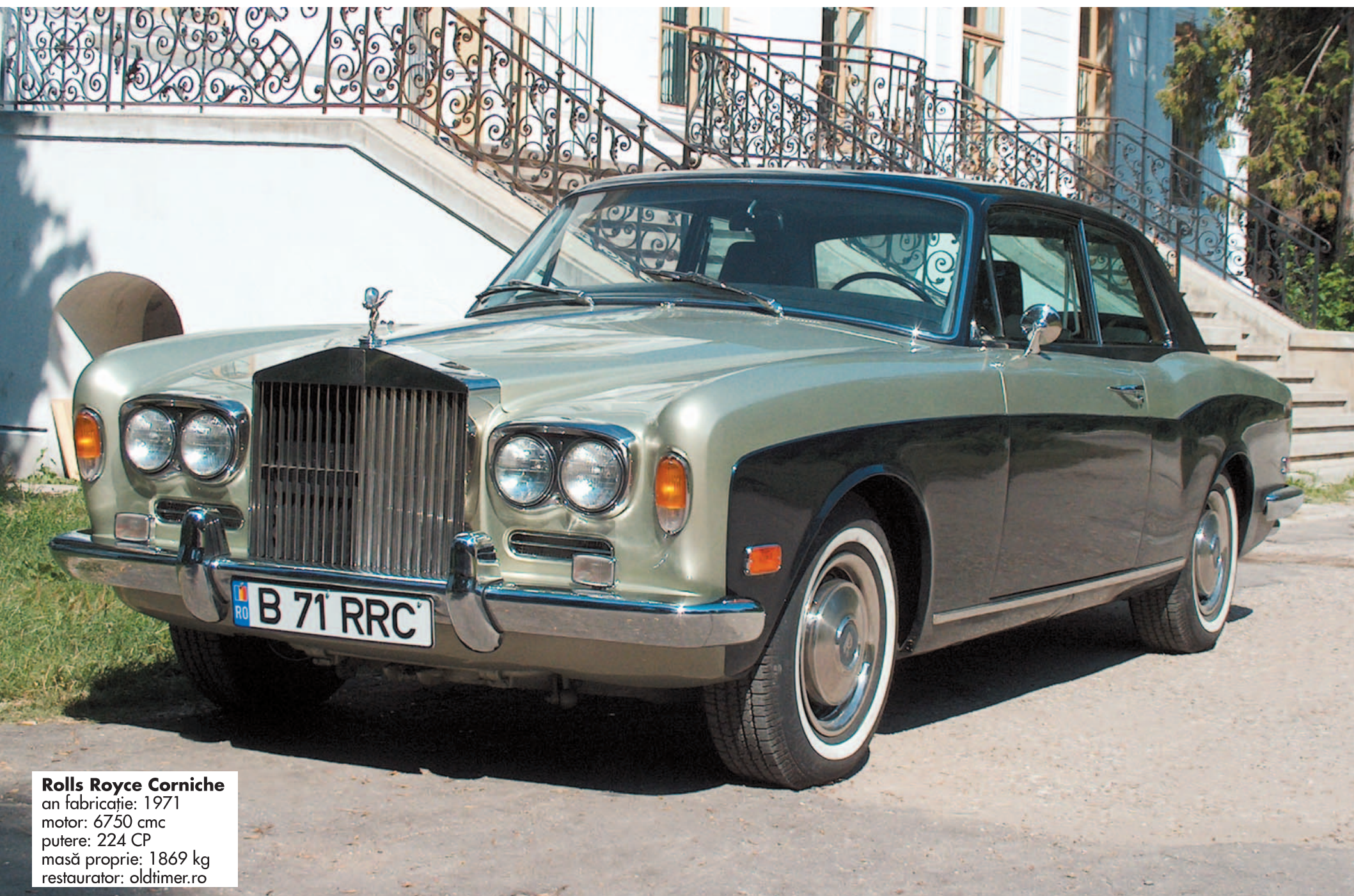
Rolls Royce Corniche an fabricație: 1971 motor: 6750 cmc putere: 224 CP masă proprie: 1869 kg restaurator: oldtimer.ro