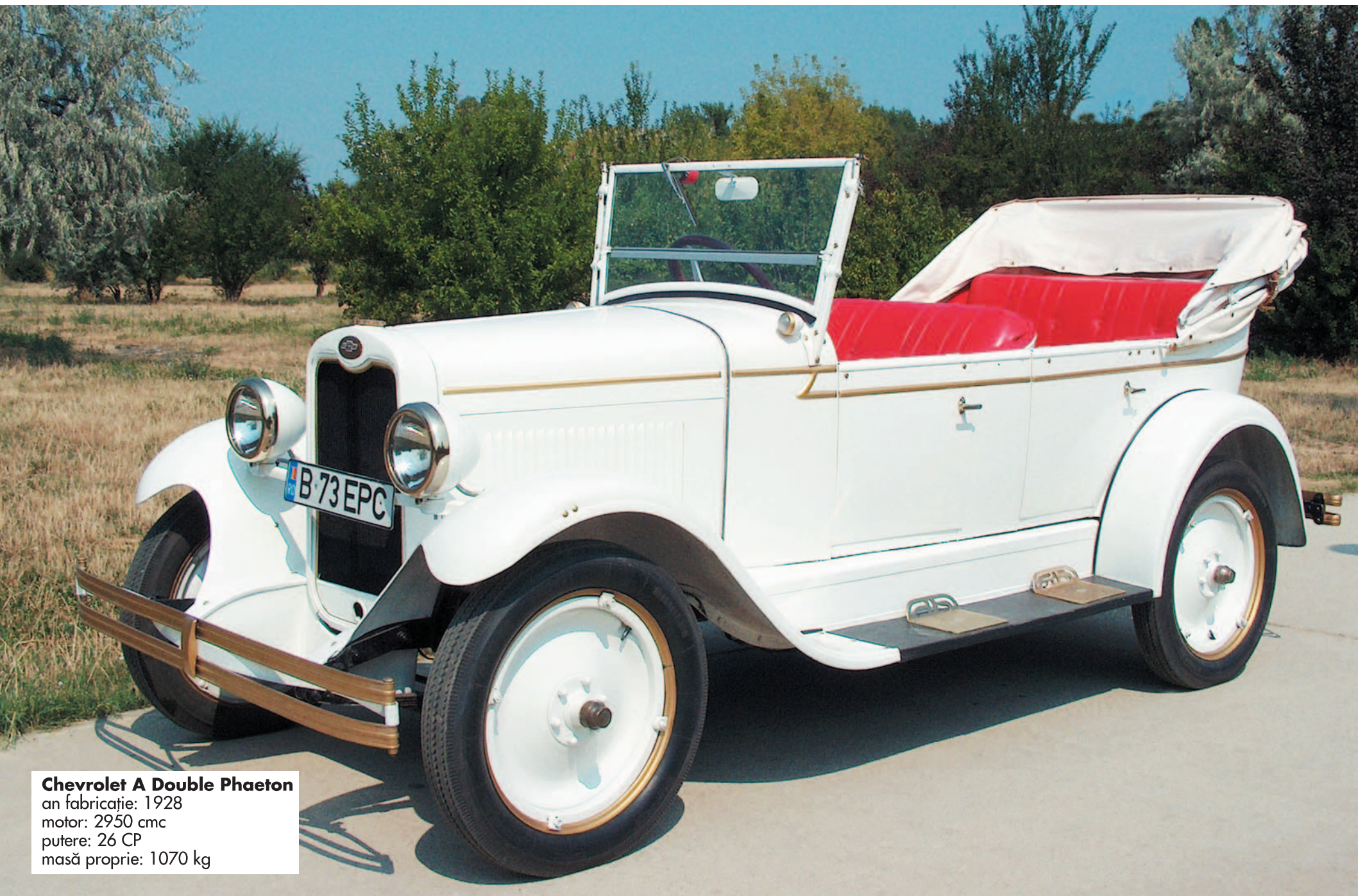
Chevrolet A Double Phaeton an fabricație: 1928 motor: 2950 cmc putere: 26 CP masă proprie: 1070 kg