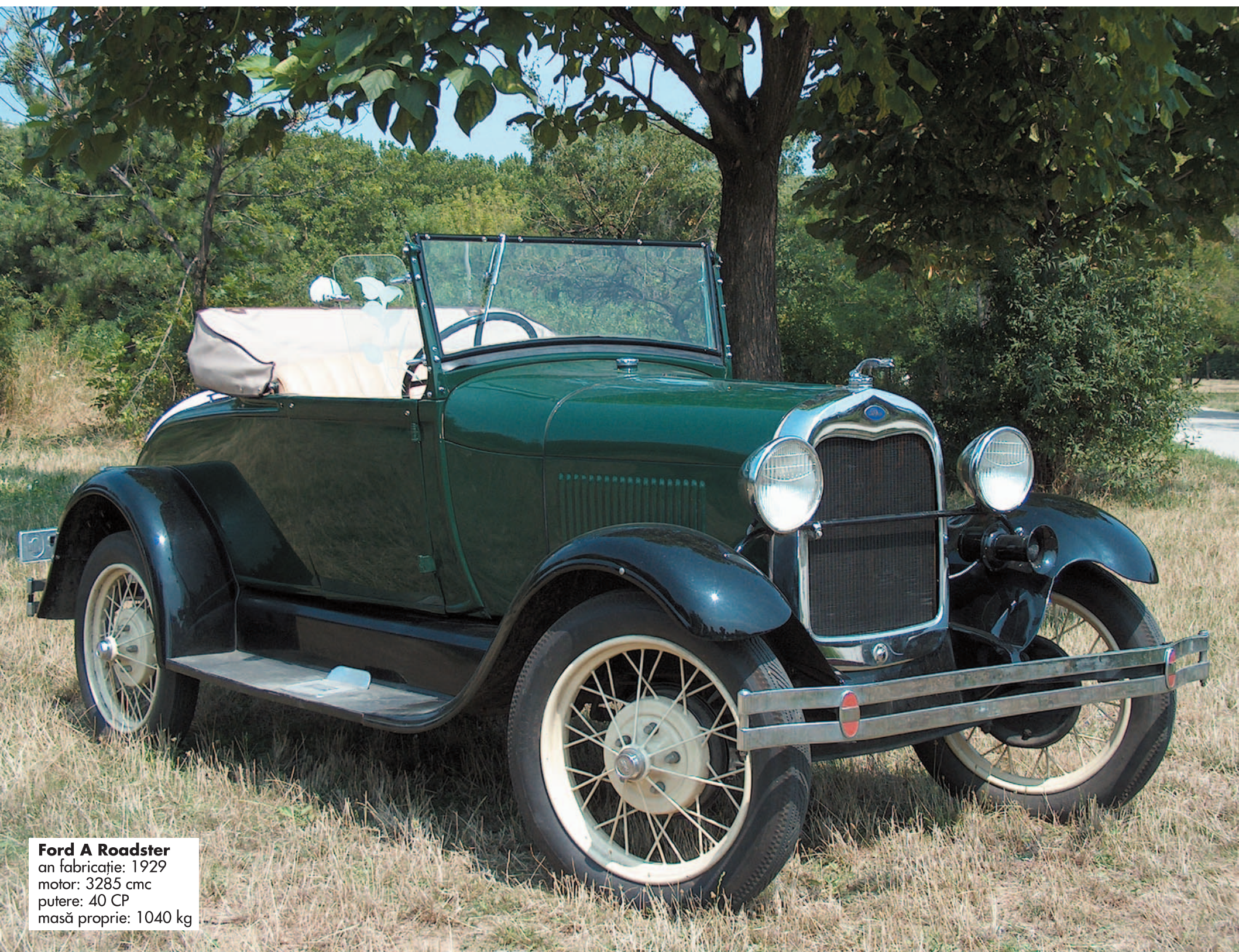
Ford A Roadster an fabricație: 1929 motor: 3285 cmc putere: 40 CP masă proprie: 1040 kg