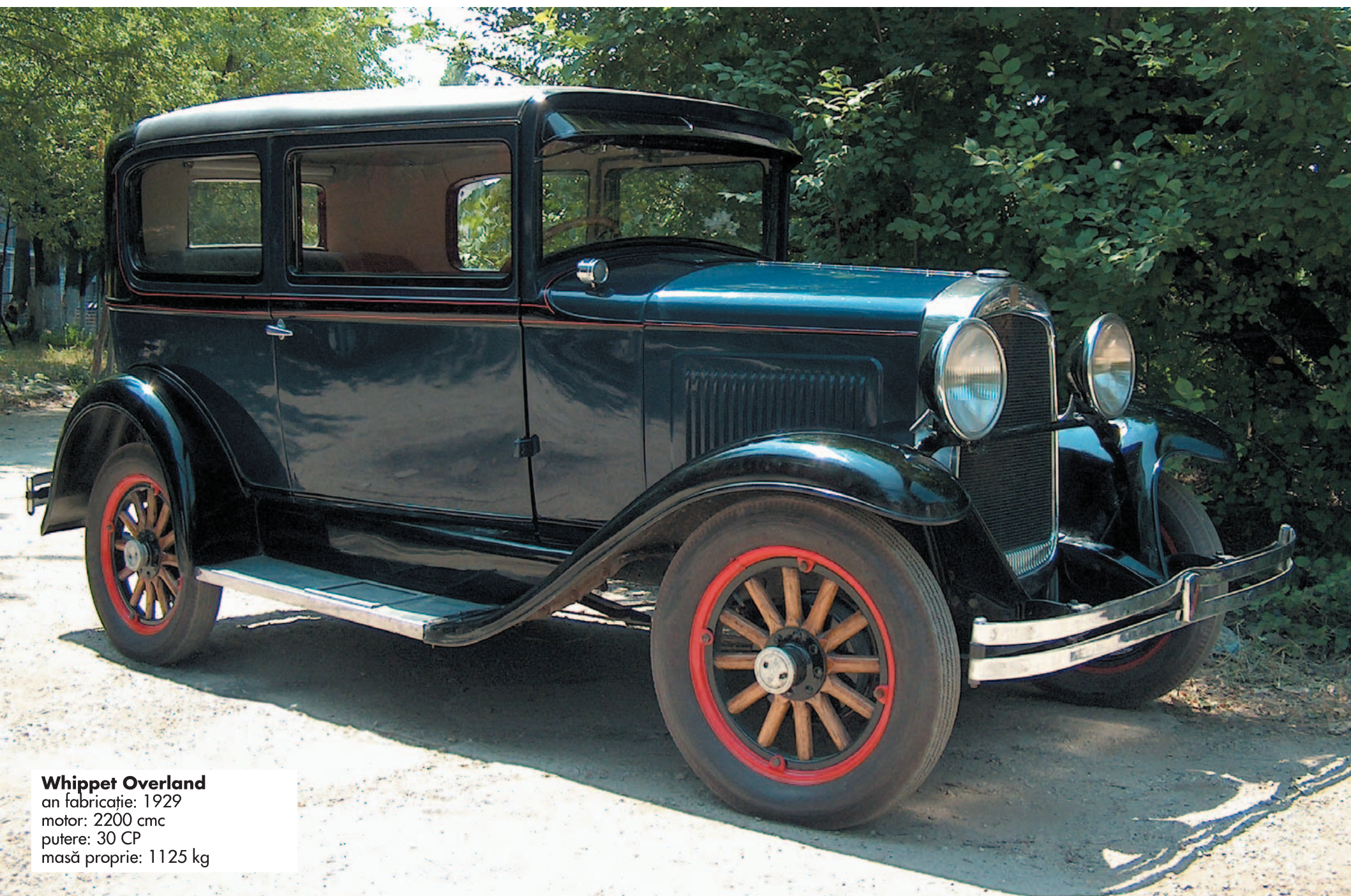
Whippet Overland an fabricație: 1929 motor: 2200 cmc putere: 30 CP masă proprie: 1125 kg