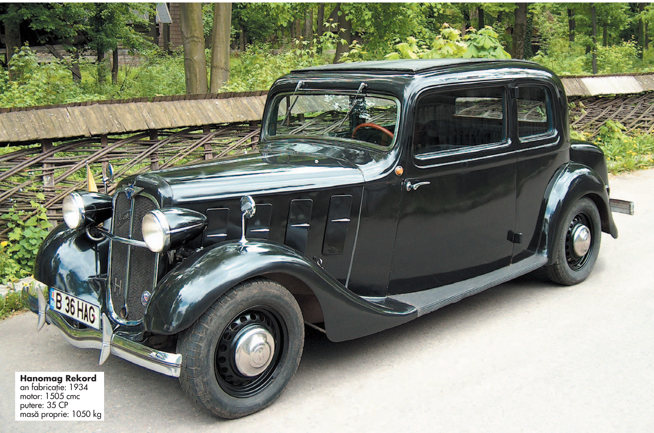
Hanomag Rekord an fabricație: 1934 motor: 1505 cmc putere: 35 CP masă proprie: 1050 kg