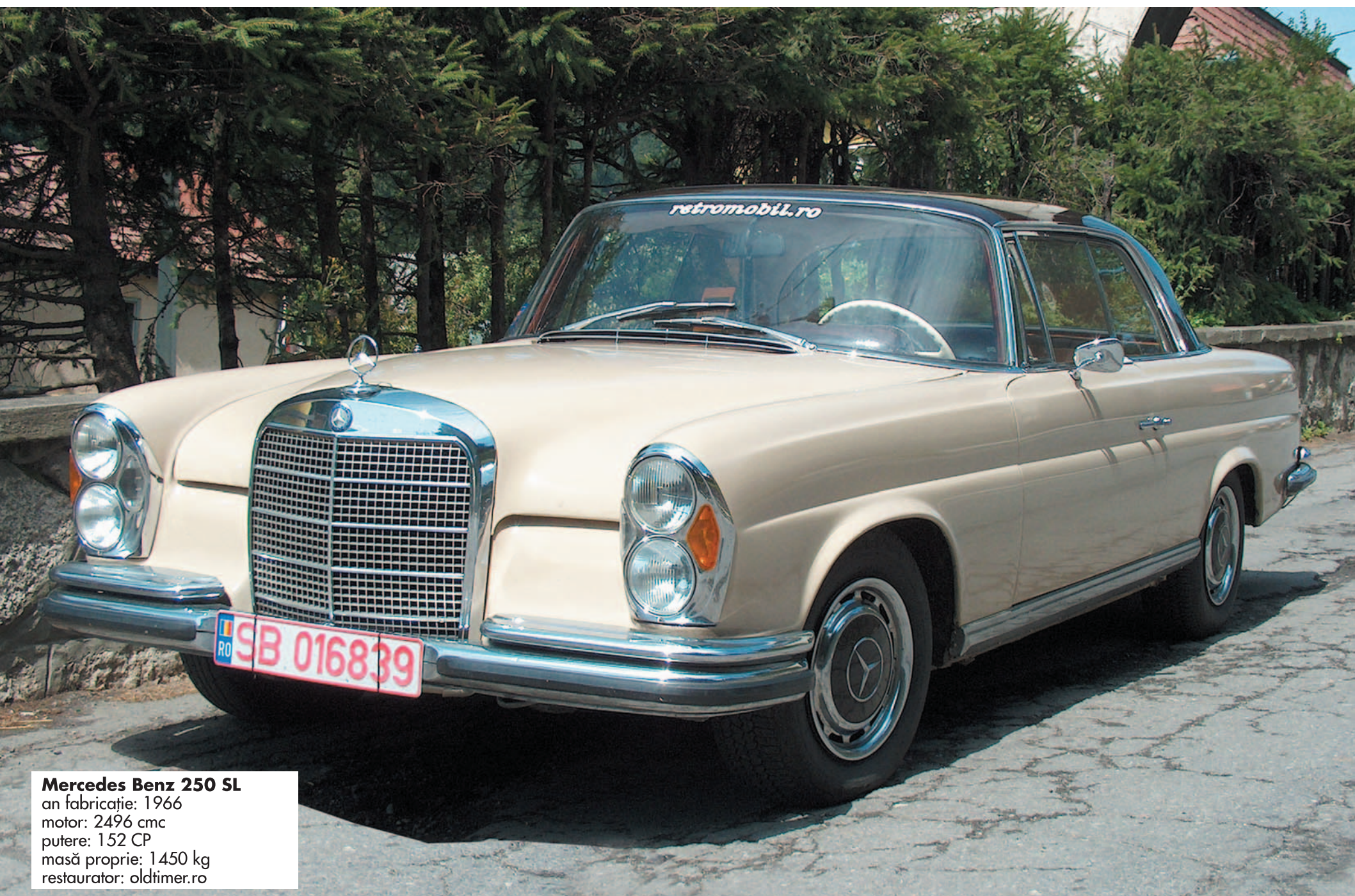
Mercedes Benz 250 SL an fabricație: 1966 motor: 2496 cmc putere: 152 CP masă proprie: 1450 kg restaurator: oldtimer.ro