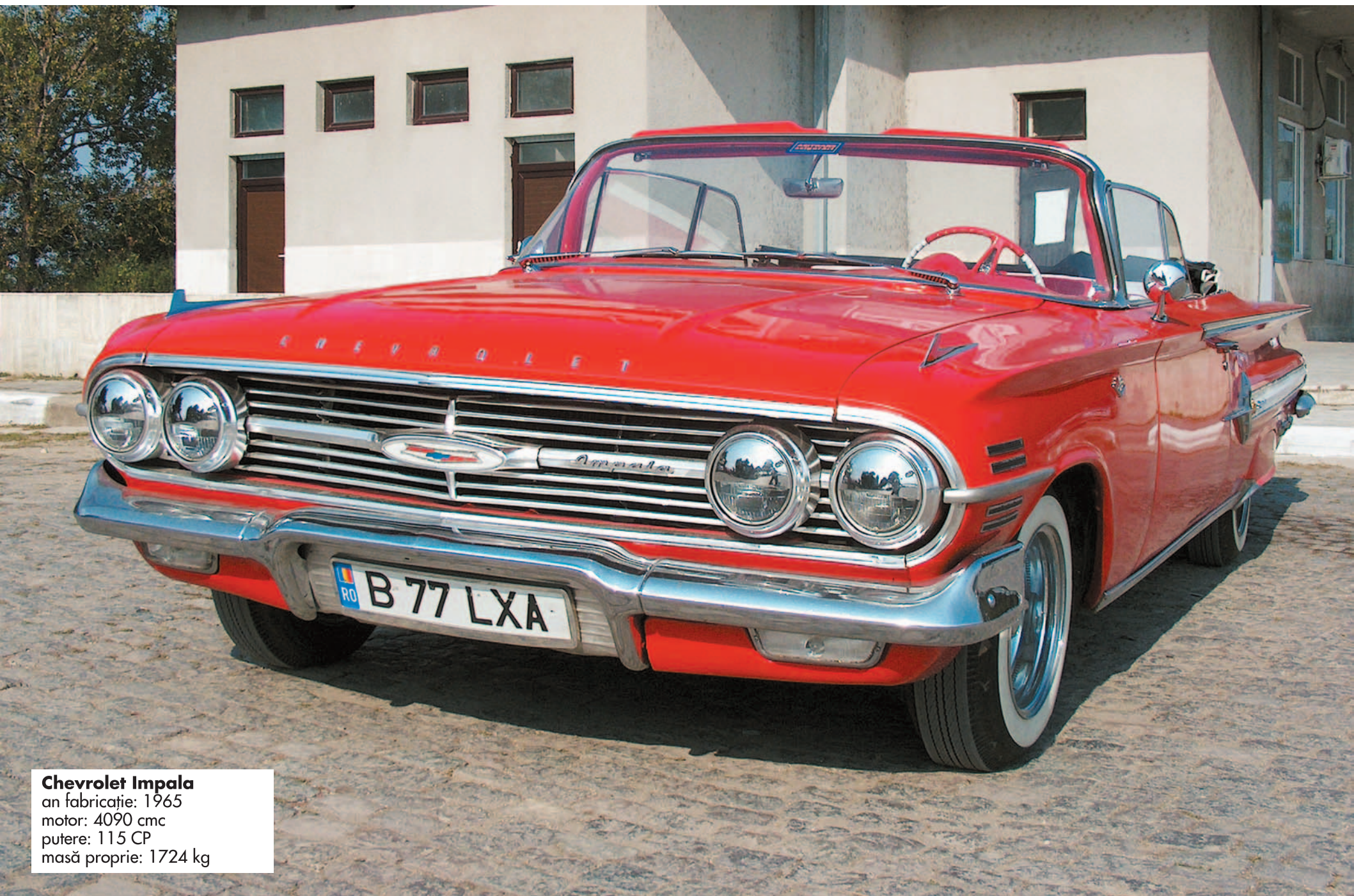
Chevrolet Impala an fabricație: 1965 motor: 4090 cmc putere: 115 CP masă proprie: 1724 kg