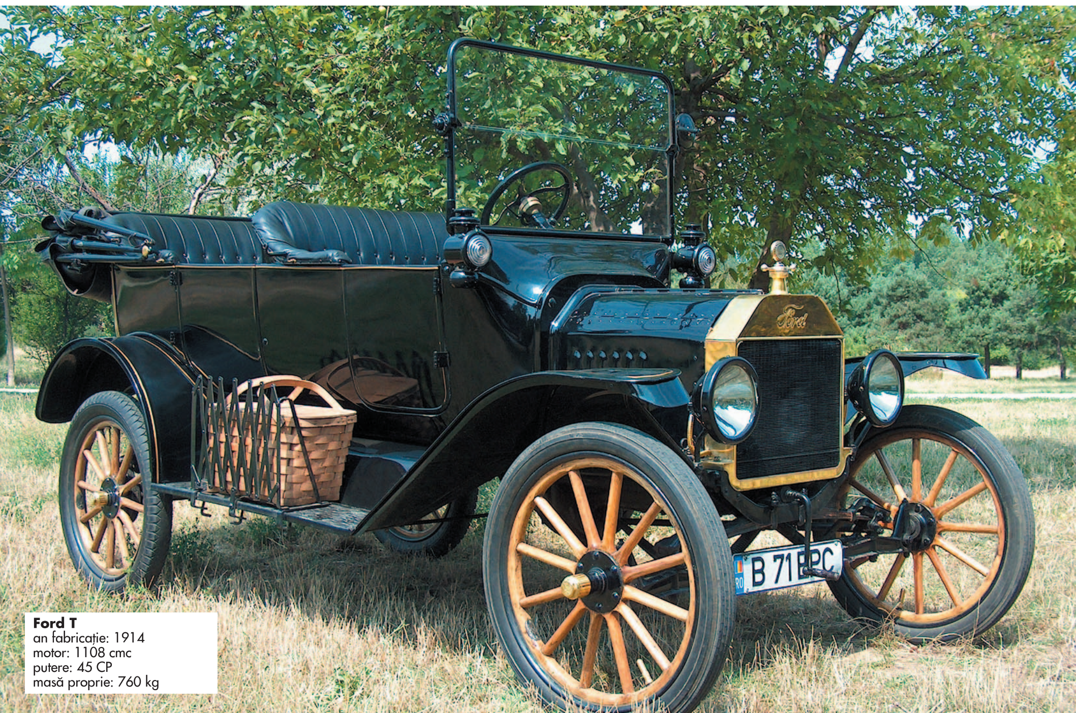
Ford T an fabricație: 1914 motor: 1108 cmc putere: 45 CP masă proprie: 760 kg