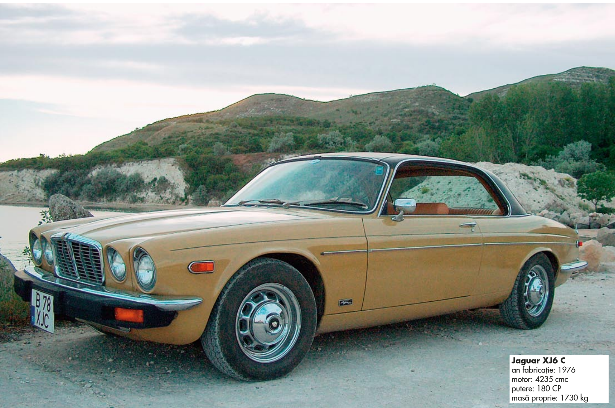
Jaguar XJ6 C an fabricație: 1976 motor: 4235 cmc putere: 180 CP masă proprie: 1730 kg