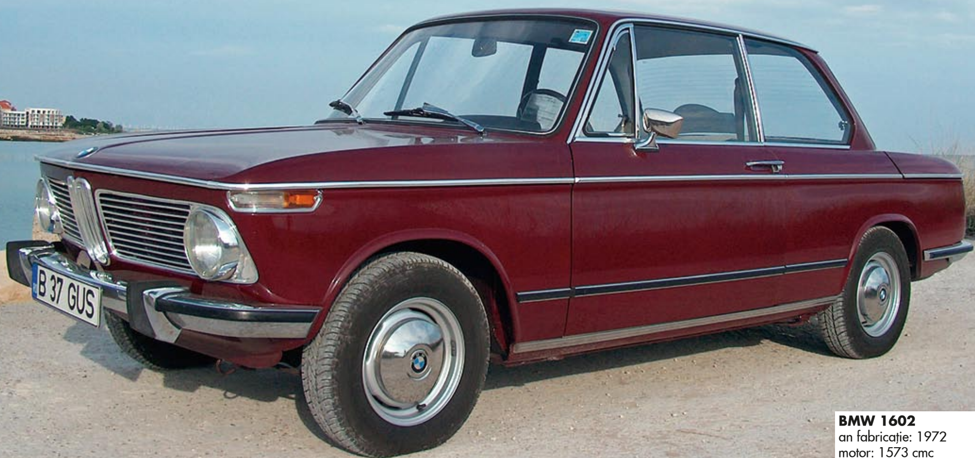
BMW 1602 an fabricație: 1972 motor: 1573 cmc putere: 85 CP masă proprie: 930 kg