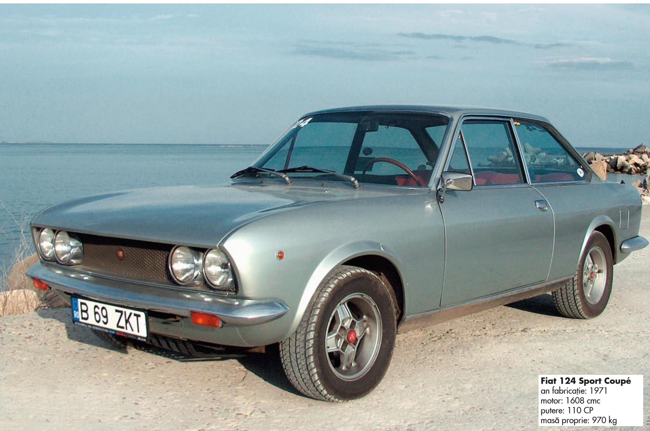
Fiat 124 Sport Coupé an fabricație: 1971 motor: 1608 cmc putere: 110 CP masă proprie: 970 kg