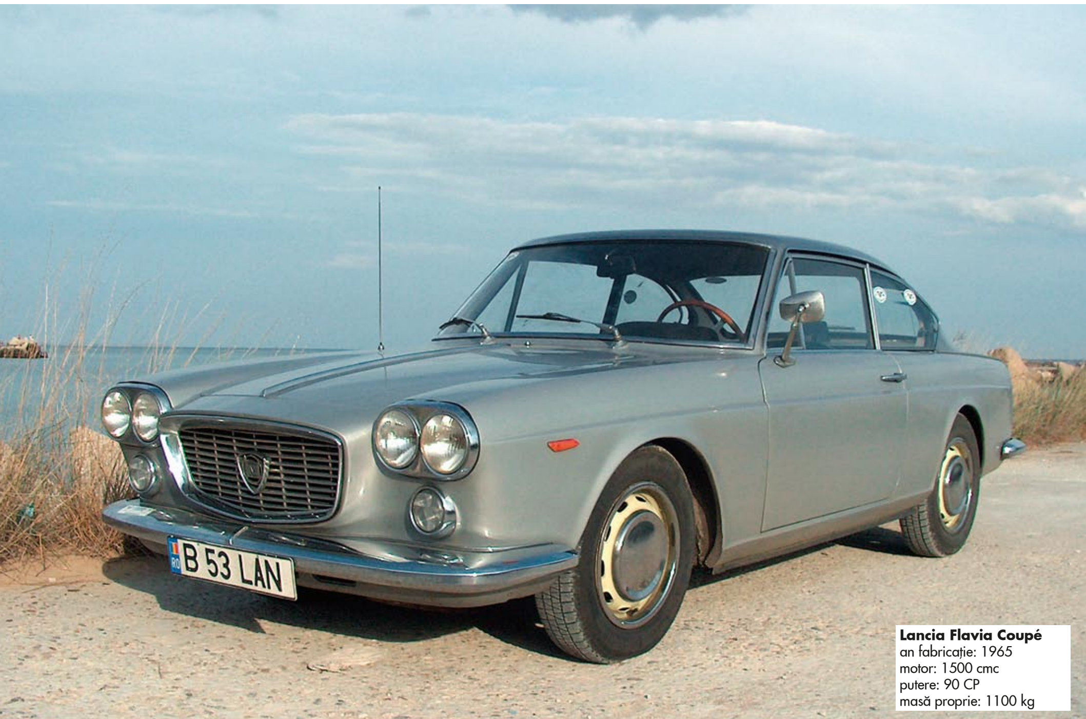
Lancia Flavia Coupé an fabricație: 1965 motor: 1500 cmc putere: 90 CP masă proprie: 1100 kg