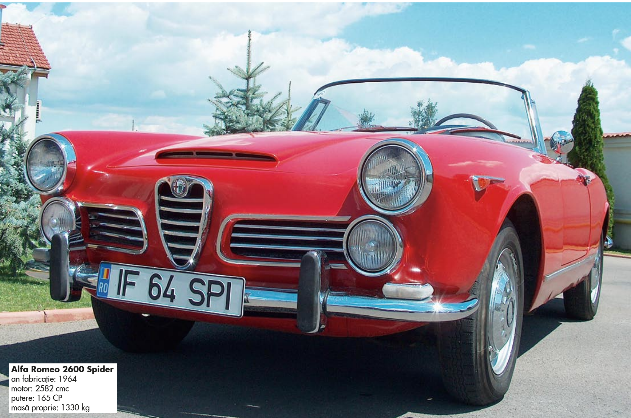
Alfa Romeo 2600 Spider an fabricație: 1964 motor: 2582 cmc putere: 165 CP masă proprie: 1330 kg