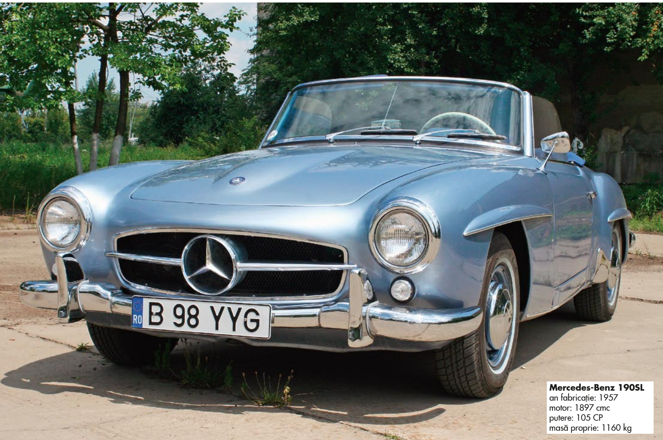
Mercedes-Benz 190SL an fabricație: 1957 motor: 1897 cmc putere: 105 CP masă proprie: 1160 kg