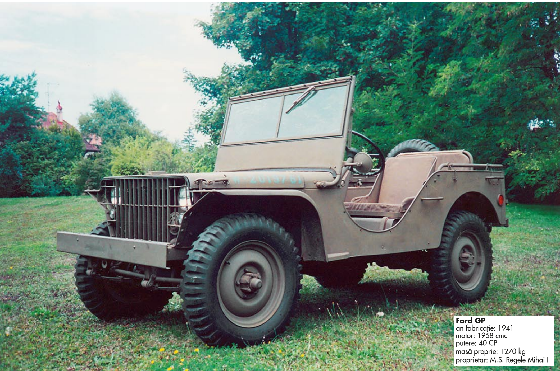
Ford GP an fabricație: 1941 motor: 1958 cmc putere: 40 CP masă proprie: 1270 kg proprietar: M.S. Regele Mihai I