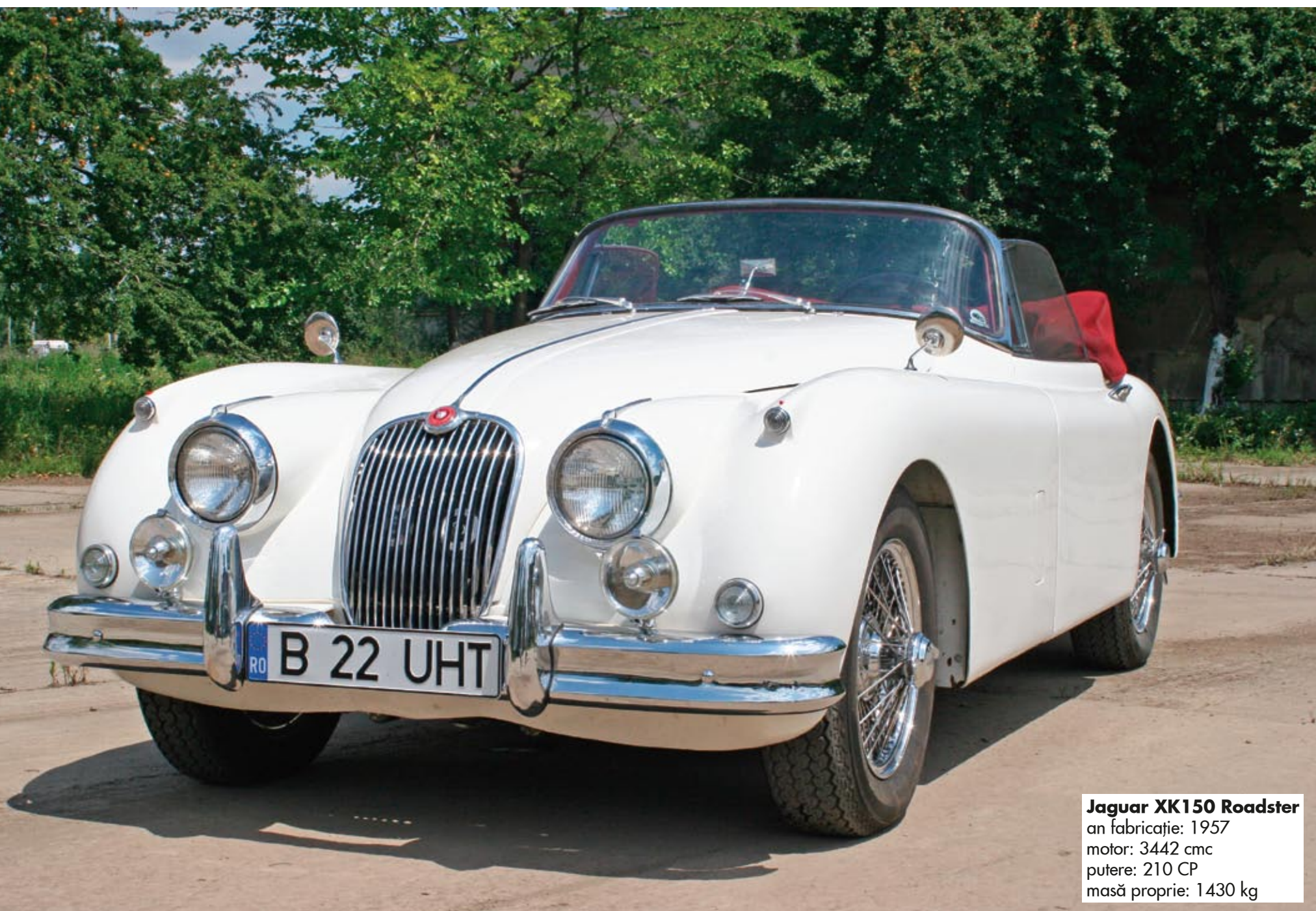
Jaguar XK150 Roadster an fabricație: 1957 motor: 3442 cmc putere: 210 CP masă proprie: 1430 kg