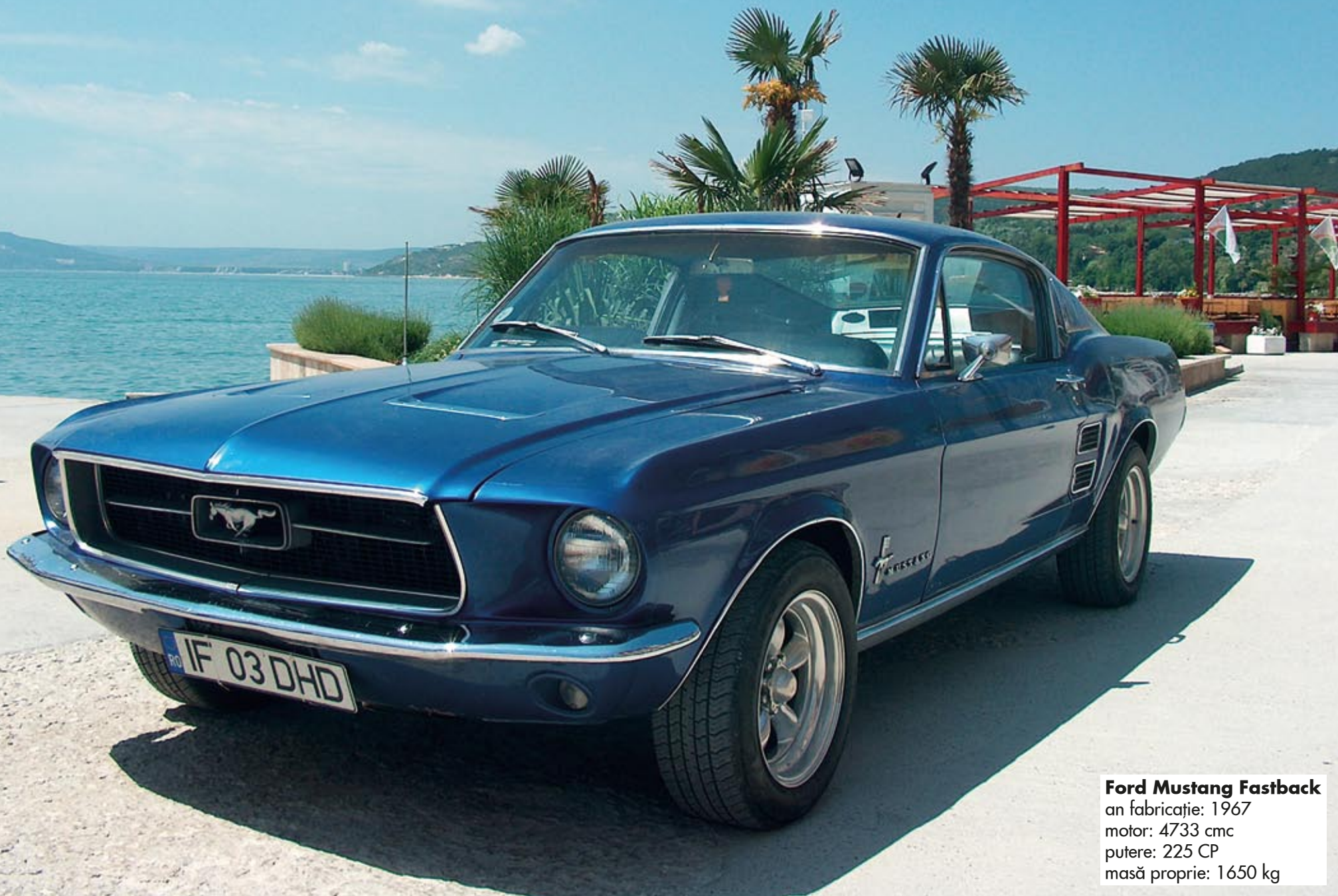
Ford Mustang Fastback an fabricație: 1967 motor: 4733 cmc putere: 225 CP masă proprie: 1650 kg