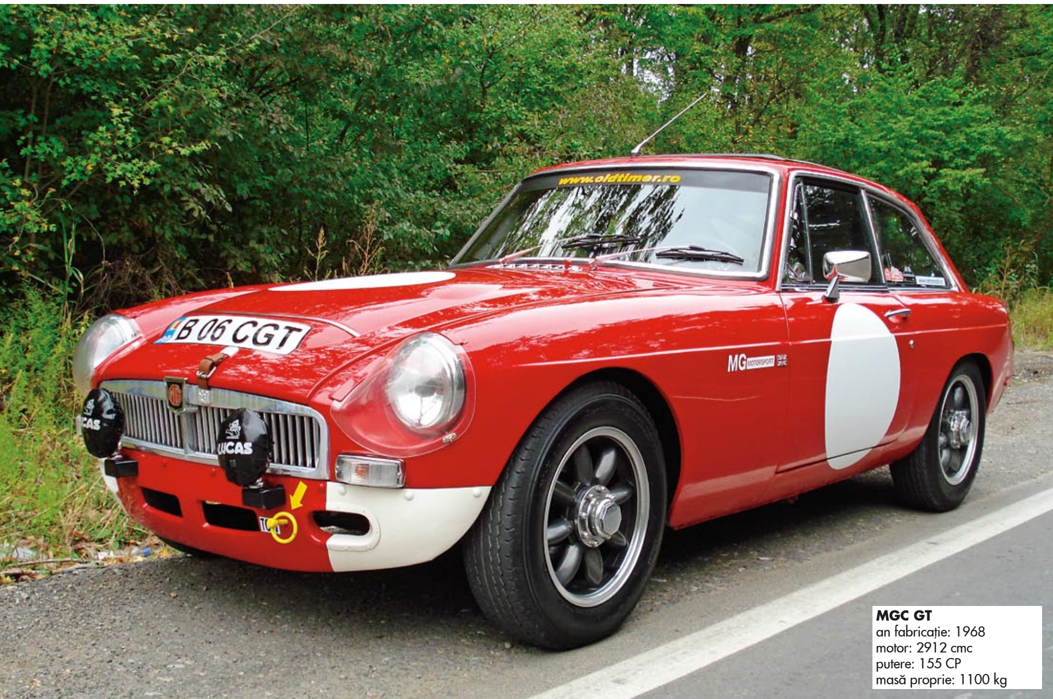
MGC GT an fabricație: 1968 motor: 2912 cmc putere: 155 CP masă proprie: 1100 kg