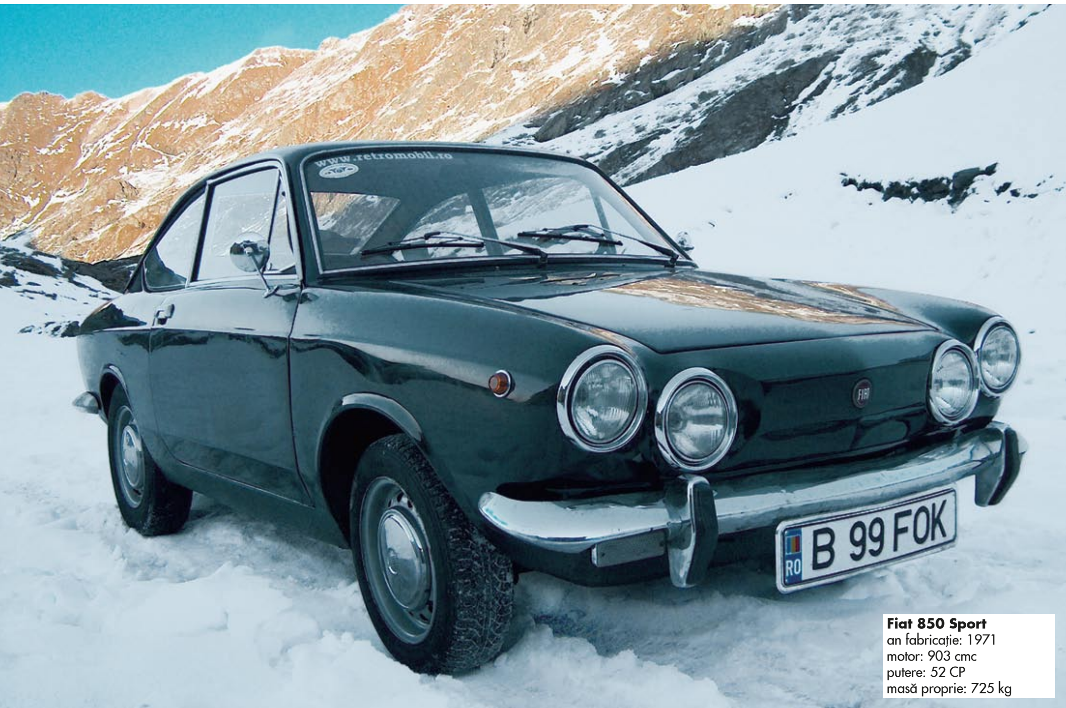
Fiat 850 Sport an fabricație: 1971 motor: 903 cmc putere: 52 CP masă proprie: 725 kg