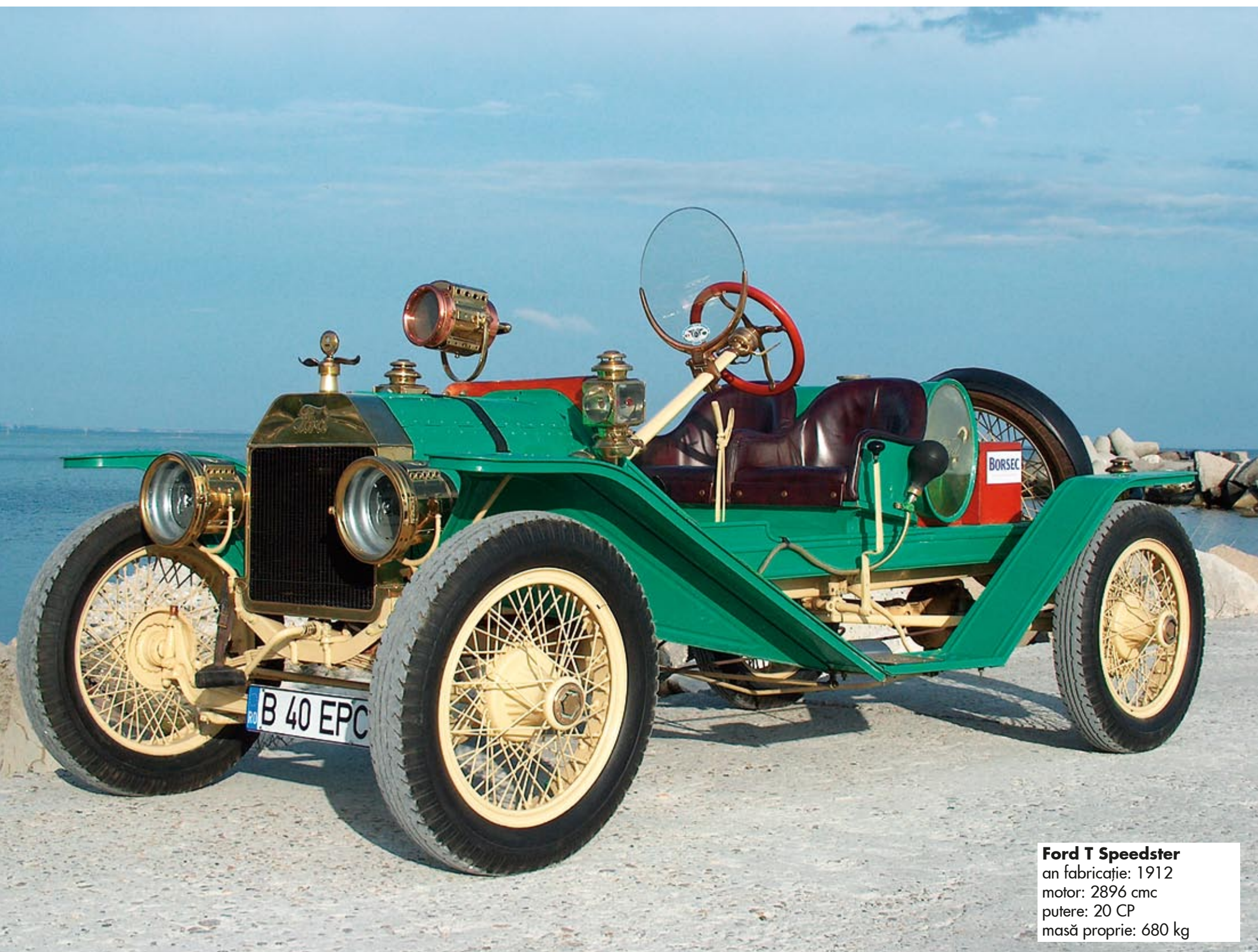
Ford T Speedster an fabricație: 1912 motor: 2896 cmc putere: 20 CP masă proprie: 680 kg